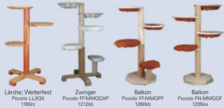
Lärche; Wetterfest Piccolo LL-3QX 1160rc Zwinger Piccolo FF-MMQXP 1212kb Balkon Piccolo FF-MMQPF 1260kb Balkon Piccolo FN-MMQQF 1205ka

Bäume nach Wunsch mit oder ohne abnehmbaren, waschbaren Thermopelz erhältlich.