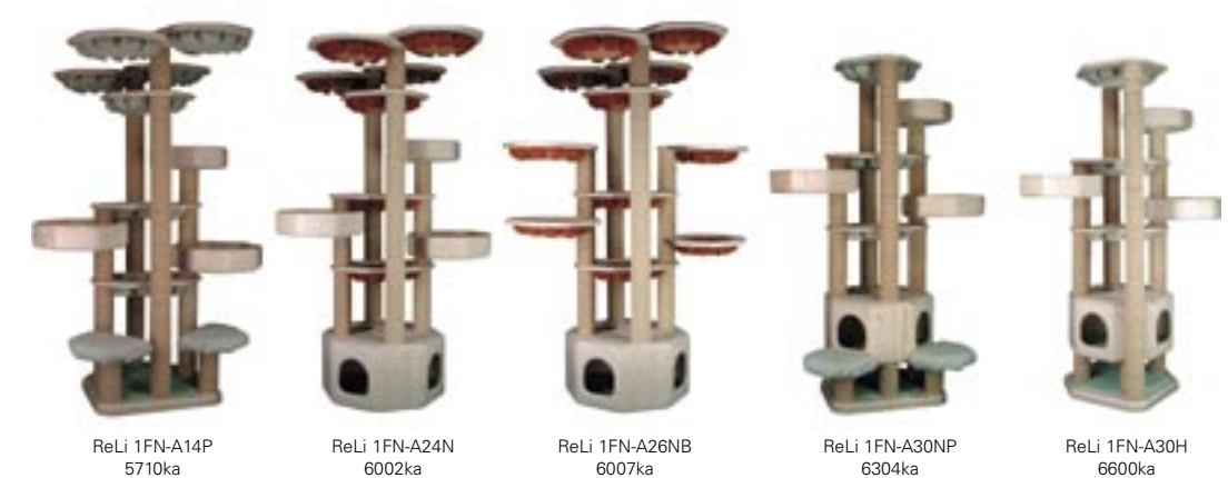
ReLi 1FN-A14P 5710ka ReLi 1FN-A24N 6002ka ReLi 1FN-A26NB 6007ka ReLi 1FN-A30NP 6304ka ReLi 1FN-A30H 6600ka