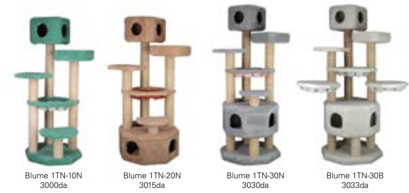
Blume 1TN-10N 3000da Blume 1TN-20N 3015da Blume 1TN-30N 3030da Blume 1TN-30B 3033da