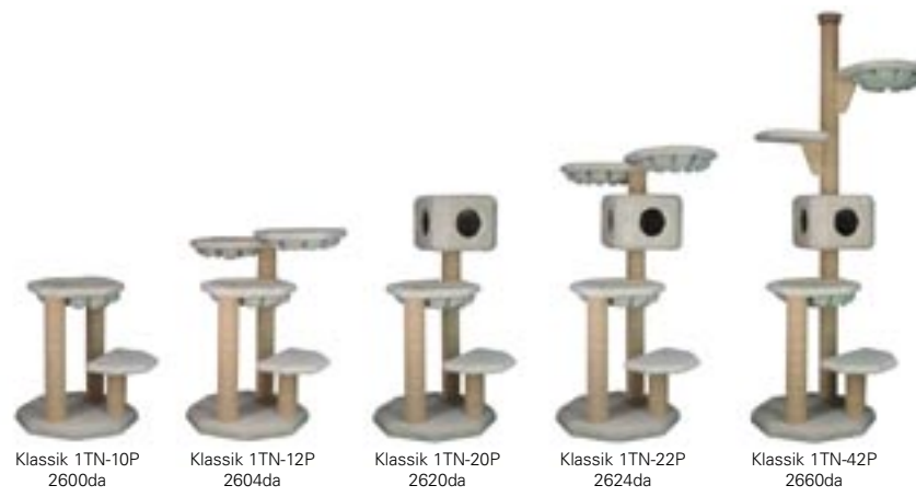
Klassik 1TN-10P 2600da Klassik 1TN-12P 2604da Klassik 1TN-20P 2620da Klassik 1TN-22P 2624da Klassik 1TN-42P 2660da