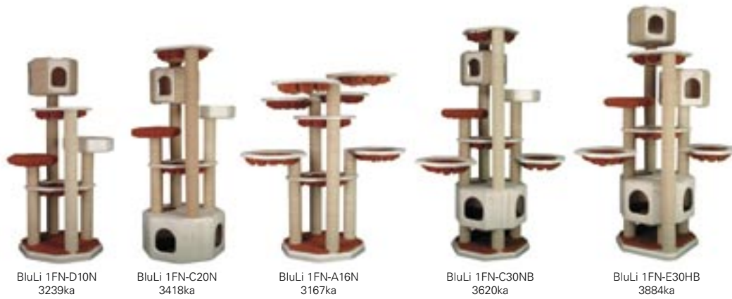
BluLi 1FN-D10N 3239ka BluLi 1FN-C20N 3418ka BluLi 1FN-A16N 3167ka BluLi 1FN-C30NB 3620ka BluLi 1FN-E30HB 3884ka

Baukastensystem: Diese Treppe kann wie eine Kette, Glied um Glied, auf jede gewünschte Länge zusammengestellt werden und wird mit 2 Schrauben an der Hauswand festgedübelt.