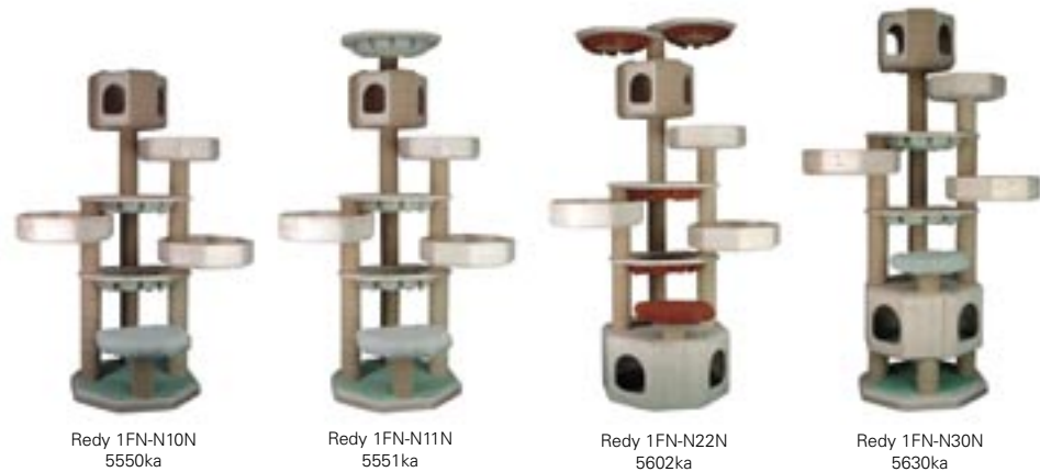
Redy 1FN-N10N 5550ka Redy 1FN-N11N 5551ka Redy 1FN-N22N 5602ka Redy 1FN-N30N 5630ka