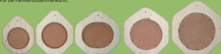
Innenmasse: Gr. 0 27 cm, Gr. 1 32 cm, Gr. 2 40 x 32 cm, Gr. 3 40 cm, Gr. 4 48 cm