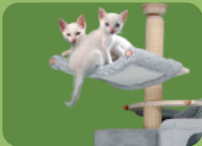
Gabelhängematten gibt's in 2 Grössen.

Stämme gibt es in 3 Ausführungen: Standard – mit Sisal Bekleidung Massiv Tanne – geeignet für den Balkon Massiv Lärche – wetterfest für Freiland. Um die wetterfestigkeit zu erhöhen, empfiehlt sich eine Dreischichten-Lackierung mit Bootslack.