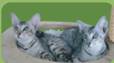
Rahmen-Hängematten gibt's in 5 Grössen.